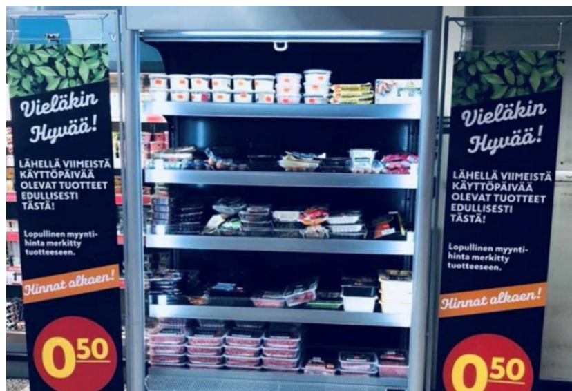
K-Citymarket Lahti Paavola ”Vieläkin Hyvää” -hylly

Hävikkituotteiden ostaminen ei ole köyhyyden ilmentymä vaan moderni ilmastotoimi.