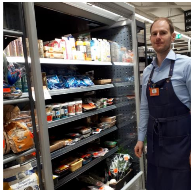
K-Supermarket Lasihytti ”Hävikkikauppa”